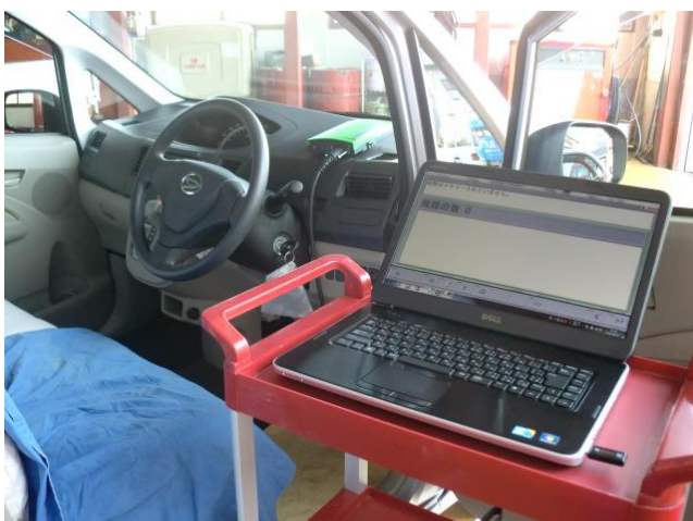
車のコンピューターと通信している様子です

当社では豊富な知識と経験、最新のテスターなどで車の出すわかりにくいSOSも見逃しません！